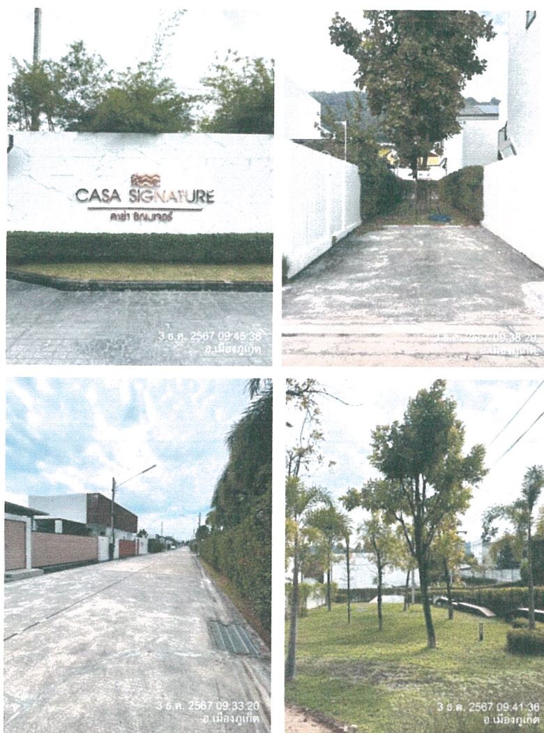
รูปภาพที่ 1.3 การใช้พื้นที่โครงการ